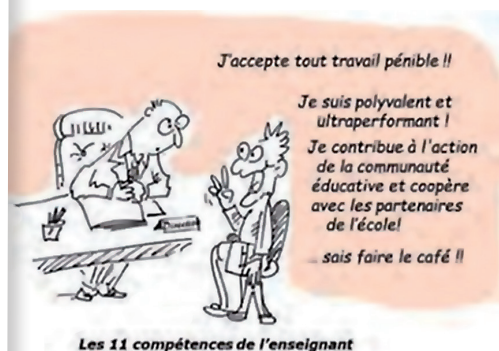
Les 11 compétences de l'enseignant

Séparer le confessionnel, qui relève de la sphère privée, du professionnel, est un élément de base de notre action syndicale